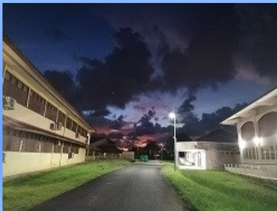
Lycée Félix Éboué